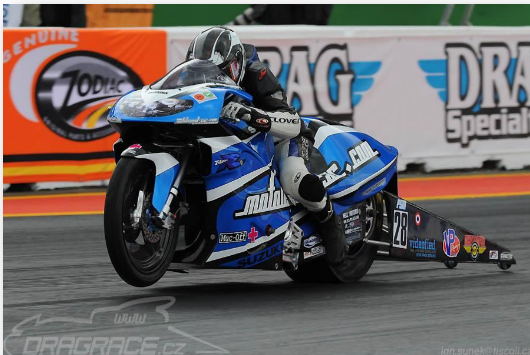
#rémi #nitrolympx 2014 Championnat d'Europe FIM